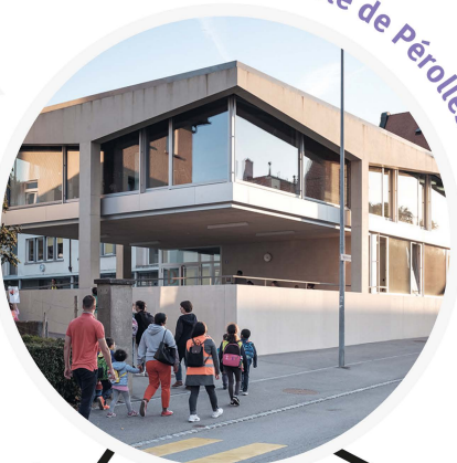
École de Pérolles

« Les plans de mobilité scolaires sont un instrument incroyable pour créer des liens solides entre les services publics, les écoles et tous les acteurs qui gravitent autour du monde scolaire. »