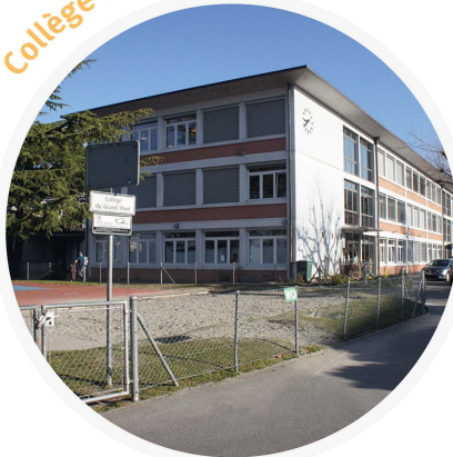
Collège du Grand-Pont

« Un PMS permet de s'éloigner d'un scénario alimenté par nos peurs d'adultes, pour plutôt mettre en lumière ce que les enfants vivent et ressentent, et ce que leurs yeux peuvent voir avec leur perspective. »